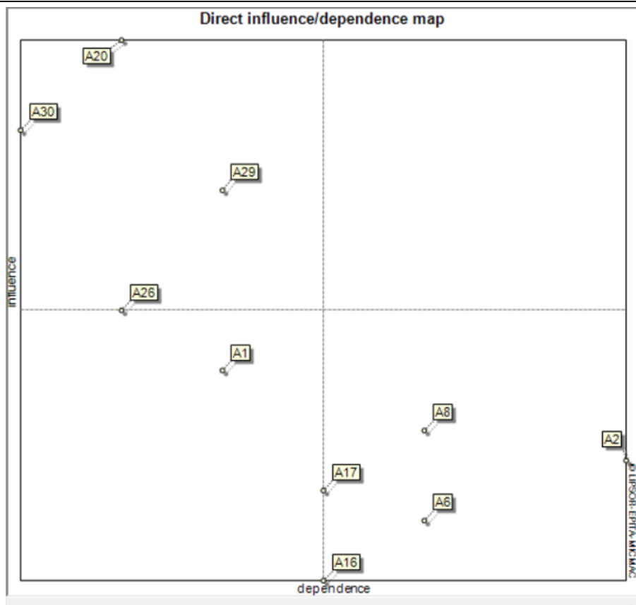
شکل ۲. نقشه اثر گذاری-وابستگی مستقیم

در نموداری که در بالا آورده شده است، چهار ناحیه متمایز وجود دارد که هر کدام بیانگر نوع خاصی از متغیرها در سیستم هستند. می توان این نمودار را مشابه یک دایره مثلثاتی در نظر گرفت که هر ربع آن ویژگی های خاص خود را دارد.