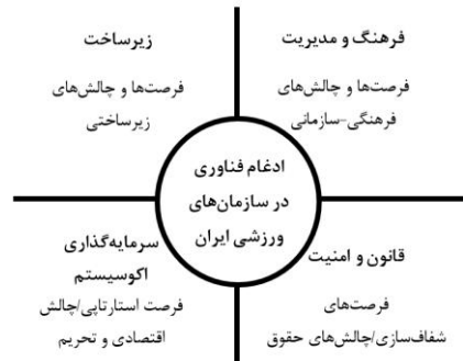
شکل (۳) نمودار مفهومی فرصت‌ها و چالش‌های فناوری در سازمان‌های ورزشی ایران

شکل (۳) بیان‌گر مدل مفهومی فرصت‌ها و چالش‌های ادغام فناوری در سازمان‌های ورزشی ایران است که در ۴ بعد طبقه‌بندی شده‌اند.